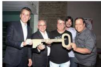
A chave de Nova Orleans será entregue ao município de Gravatá.