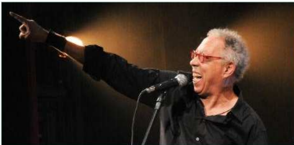
O "maldito" Jards Macalé é uma das atrações do Gravatá Jazz Fest

Entre 6 e 9 de fevereiro, evento terá shows, gastronomia e cinema