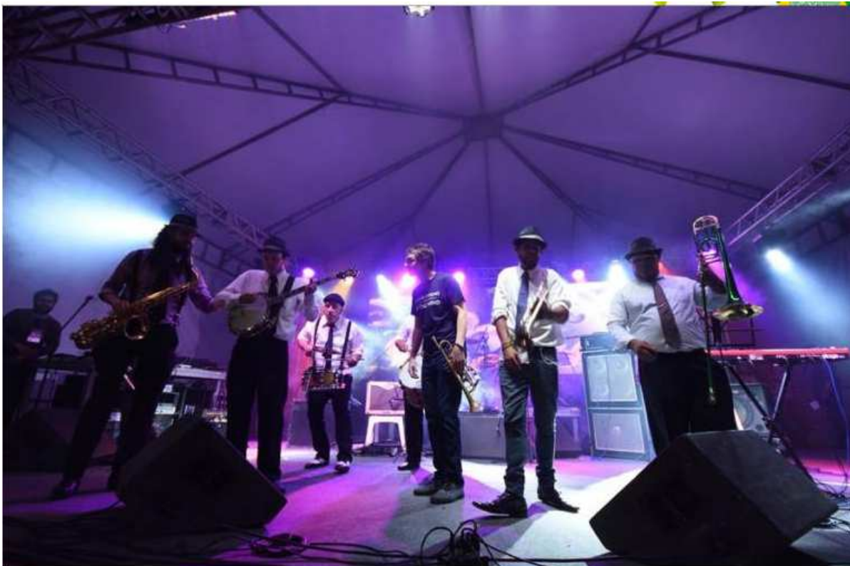
Músicos tocaram clássicos do Jazz e blues aos que queriam curtir um carnaval alternativo