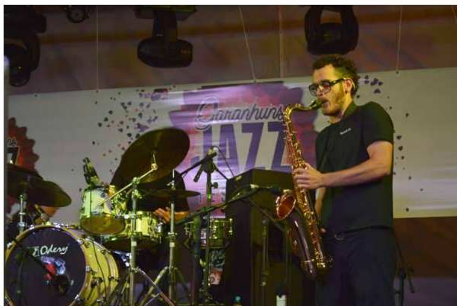
Garanhuns Jazz Festival fazia parte do Carnaval alternativo no Agreste