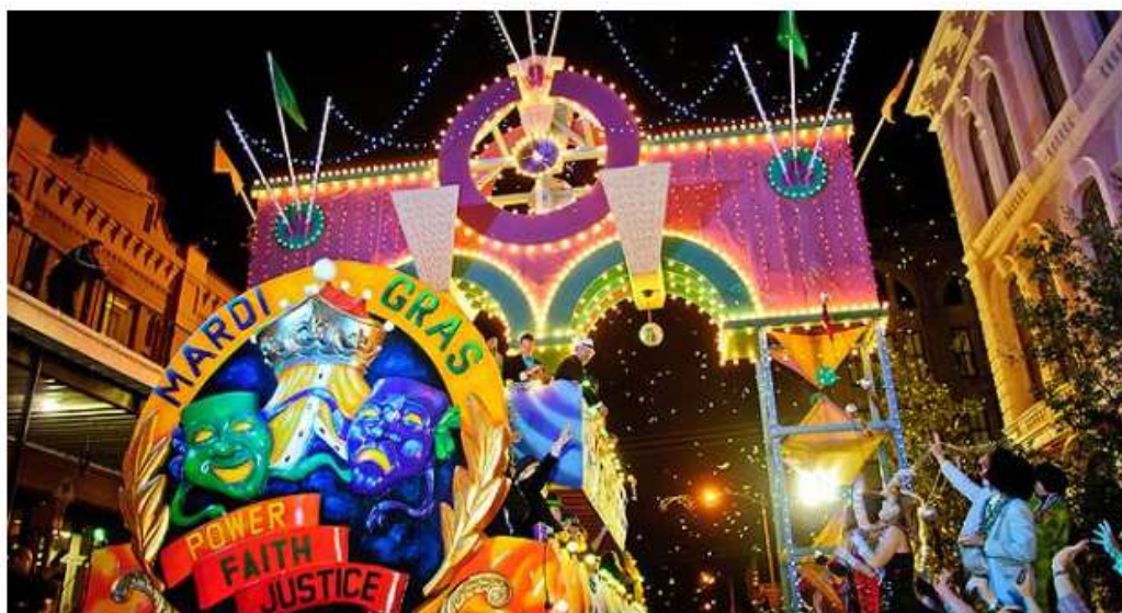
Mardi Gras vai desfilhar em cortejo pelas ruas de Gravatá.

Festival ocorre entre os dias 6 e 9 de fevereiro, em Gravatá, Agreste do estado