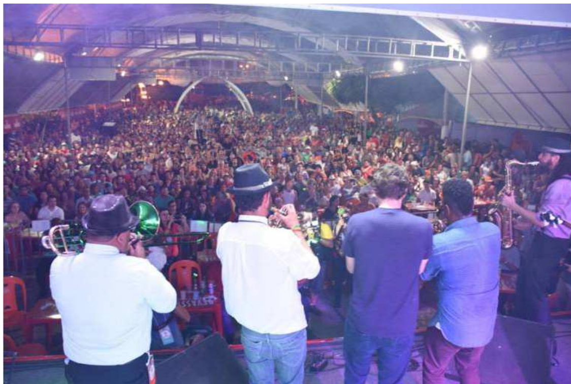
Praça de Eventos da Cidade lotou