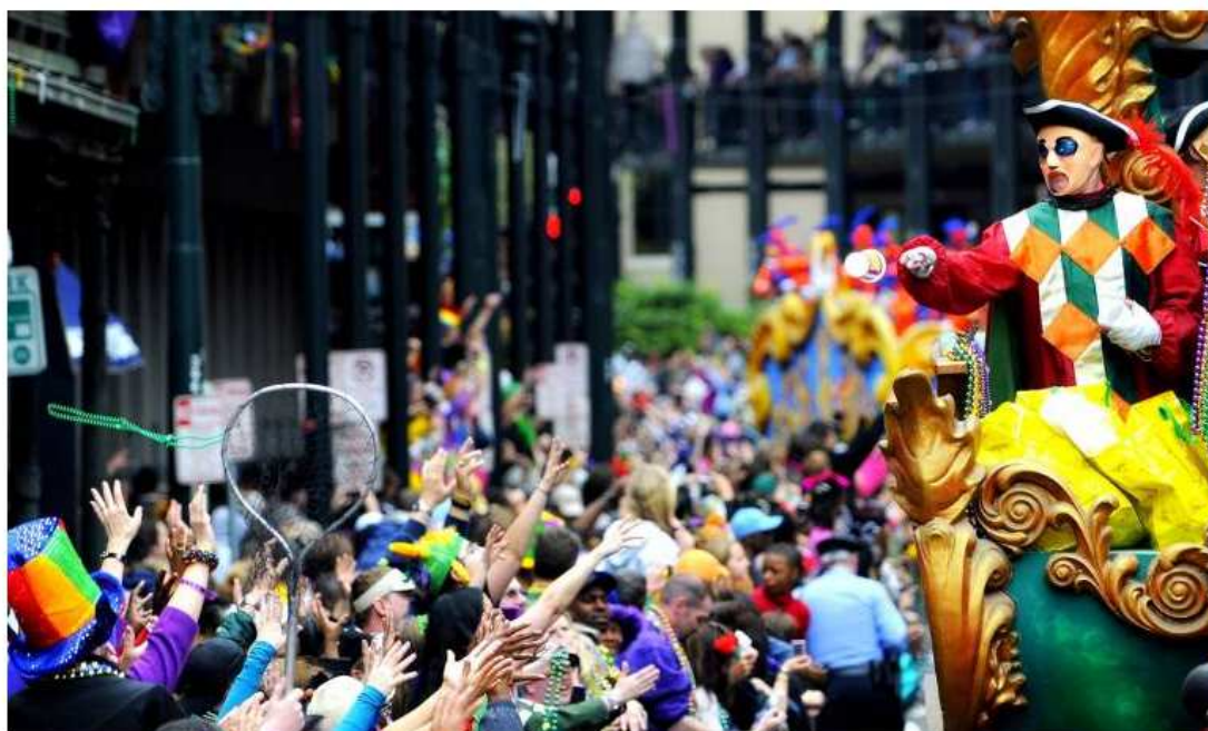
Gravatá Jazz Festival terá desfiles de carros antigos