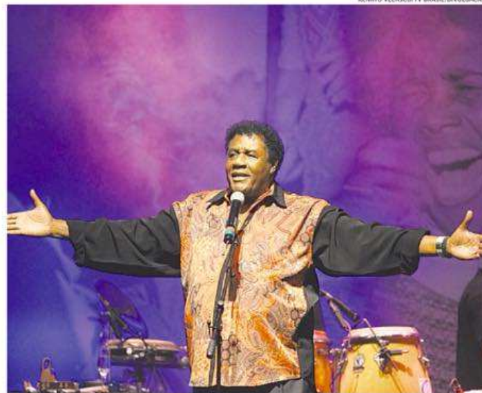
Tony Tornado será uma das atrações do festival, que chega à cidade pela primeira vez