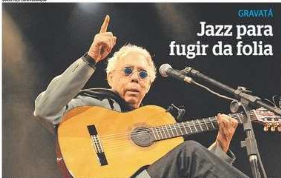
Jards Macalé é uma das principais atrações do evento realizado no Agreste e sobe ao palco na abertura, às 20h

Quem dispensa a folia do carnaval pernambucano, mas não abre mão de shows ao vivo tem boa opção a 84 quilômetros do Recife. A cidade de Gravatá, no Agreste, abriga, de amanhã até a terça-feira, festival de jazz antes realizado em Garanhuns. Apesar da versão reduzida, o evento consegue manter atrações de peso do circuito alternativo, como Jards Macalé (amanhã) e Tony Tornado. Outros destaques são Rodrigo Santos (Barão Vermelho, também amanhã), Tico Santa Cruz, vocalista do Detonautas (no domingo) e Derico (da banda de Jô Soares, na terça-feira).