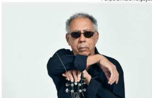
O músico Jards Macalé é uma das atrações do evento

Para aqueles que preferem fugir da agitação de Recife e Olinda nestes dias de folia, um dos destinos possíveis dentro de Pernambuco é o município de Gravatá, onde é realizada a primeira edição do Gravatá Jazz Festival. O evento, que tem início neste sábado (06) e segue até a próxima terça-feira (09), reúne shows, concertos em igrejas, exibições de filmes, recreação infantil, circuito gastronômico, oficinas e feiras.