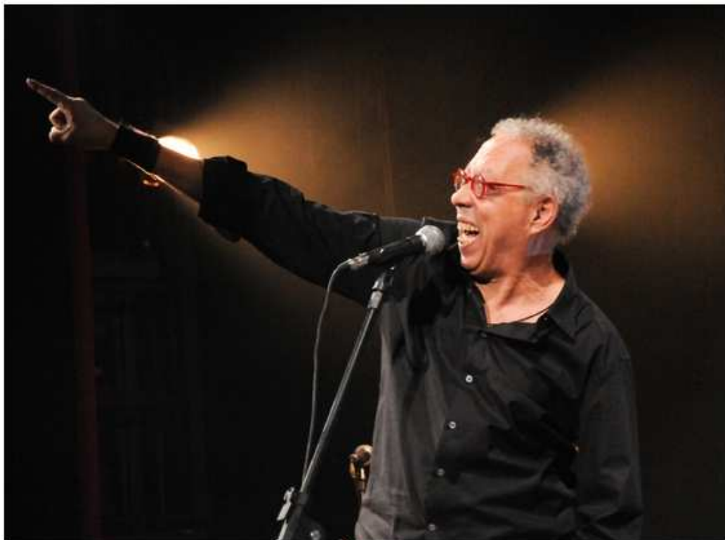
Jards Macalé faz show no Jazz Festival