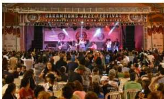
Festival era realizado em Garanhuns

Os amantes da boa música podem se programar para passar o Carnaval de 2016 em Gravatá, no Agreste de Pernambuco. A diversão estará garantida com a realização do Festival de Jazz, evento internacionalmente conhecido, que, pela primeira vez, será realizado na cidade.