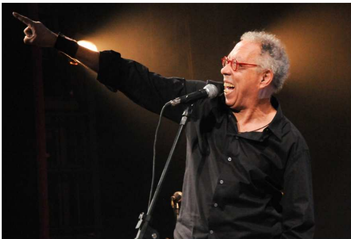
Jards Macalé 1024x758

Foram anunciadas nesta terça-feira (26/01) as atrações do Gravatá Jazz Festival, que ocorre de 6 a 9 de fevereiro, simultaneamente à programação do carnaval. Já no primeiro dia de evento, o cantor carioca Jards Macalé se apresenta junto com o guitarrista argentino Victor Biglione. O ícone da soul music brasileira, Toni Tornado, e um dos criadores da Bossa-nova, Roberto Menescal, também passam pelo festival e prometem empolgar o público.