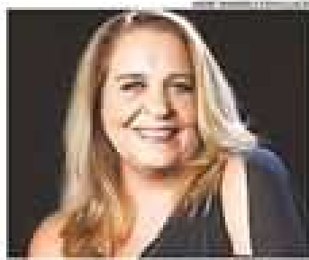
Wanda Sá é um dos nomes fortes da Bossa Nova

inclui, ainda, cinema, performances e edição de filmes dedicados à vida e obra de artistas do blues e do jazz. Segundo estimativa dos organizadores, o festival deve reunir 50 mil pessoas, com 10% de ocupação familiar e participação econômica entre R$ 2 milhões e R$ 3 milhões. A área localizadora, a primeira etapa de organização da capital pernambucana, é feita