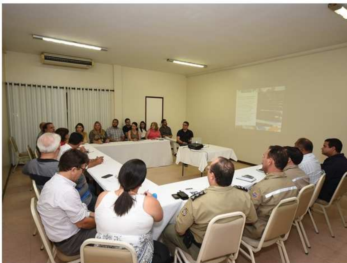
Reunião debateu estrutura do Gravatá Jazz Festival

Segurança terá participação da Guarda Municipal e do Corpo de Bombeiros. Estrutura do evento foi debatida em reunião realizada em hotel de Gravatá.