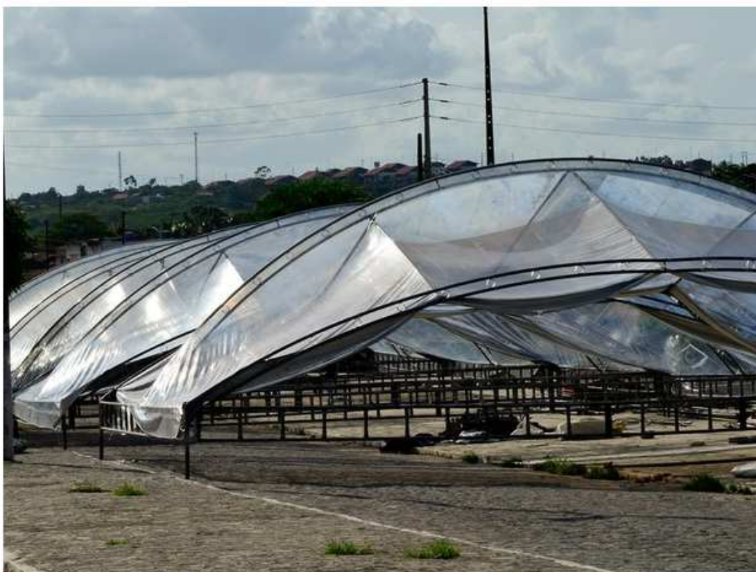
Estrutura do Gravatá Jazz Festival começa a ser montada