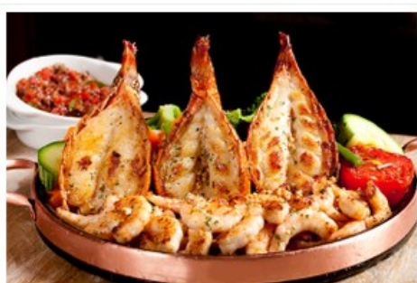
Grelhados do Chef chegam a servir cinco pessoas

A fim de atender quem busca por pratos saudáveis, o cardápio traz boas sugestões. Assim sendo, a salada oriental vem com alface americana, rúcula, camarões marinados com shoyu, mel e gengibre. Além disso, acompanham abacaxi grelhado, amêndoas e tomate cereja. E tem mais: também entrou recentemente no cardápio a linha Delícias Fit . O filé de salmão grelhado regado com molho chimichurri e cubos de manga é um sucesso no Rio de Janeiro. Acompanha alface americana, palmito, amêndoas, tomate cereja e purê de batata doce gratinado.