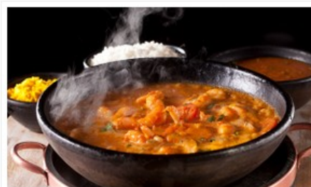
Moqueca de Camarão é outra das delícias do cardápio

“Tem início às 17h e se encerra às 20h. Todos os chopes e coquetéis terão desconto de 50%, além de um cardápio especial de petiscos e peixes com valores reduzidos”, adianta Sylvio.