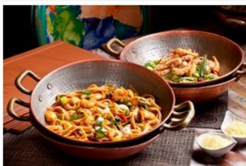
Camarada Camarão inaugurar á em Fortaleza sua sétima unidade nacional no fim deste mês de junho

Os fãs de frutos do mar em Fortaleza terão na rede pernambucana Camarada Camarão mais uma interessante opção gastronômica local. A marca anunciou sua chegada ao estado, com inauguração de uma nova unidade prevista para o dia 26 de junho. A loja ficará no Shopping RioMar Fortaleza , contando com mil metros quadrados e capacidade de atendimento de 300 pessoas . O empreendimento faz parte de um plano de expansão do grupo Drumattos (responsável também pela rede Camarão & CIA , conta com mais de 50 unidades no Brasil). Dessa forma, a