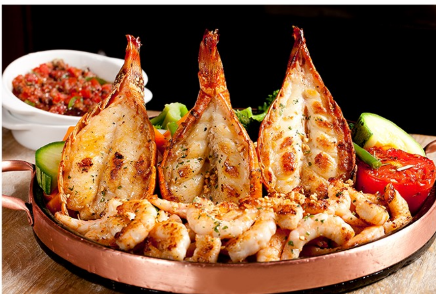
Grelhado do Chef.

No quesito prato principal o Camarada traz a tradicional moqueca em várias versões. A Moqueca de Camarão (R$ 132), moqueca preparada em panela de barro vem acompanhada de arroz branco, farofa de dendê e pirão.