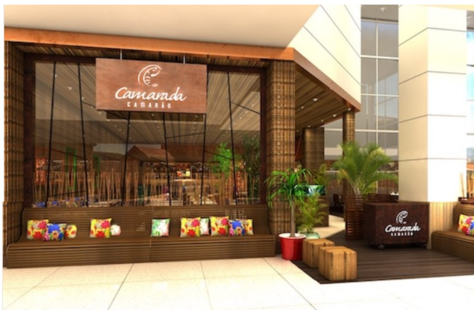
Camarada Camarão inaugura no Riomar Fortaleza