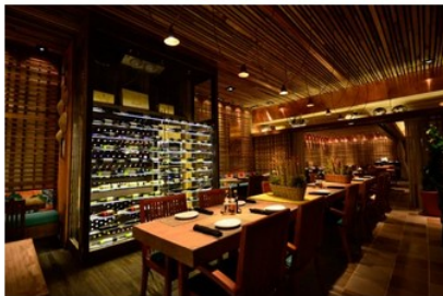
Operação do Camarada Camarão em Recife.

Previsto para abrir em junho, no RioMar Fortaleza, empreendimento terá mil m2 com cardápio variado a um custo que varia de R$ 69 a 89 para duas ou três pessoas.