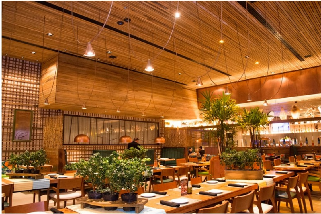
A unidade do restaurante no Shopping RioMar Fortaleza é a primeira no Ceará

O Camarada Camarão em Fortaleza funcionará de domingo a domingo. Todos os dias, o restaurante oferece happy hour entre 17h e 20h. Ao todo, a rede pernambucana possui sete unidades espalhadas pelo país. Essa é a primeira no Ceará .