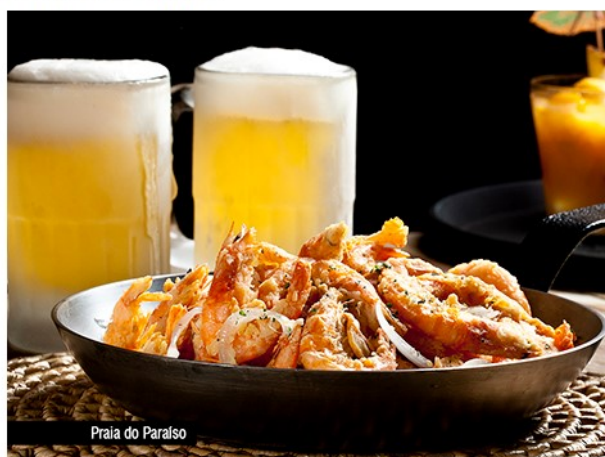
Prato Praia do Paraíso.

O prato Camarões Praia do Paraíso (Porção 1/2 kg – R$ 49 a R$ 45 no Happy Hour) são camarões inteiros, marinados no chopp, fritos e salteados com alho e cebola. E para quem prefere petiscar, o Pastel de Camarão com Cream Cheese (unidade – R$ 10,90), o Pastel de Carne de Sol (unidade – R$ 9,90) e o Pastel de Queijo Coalho com Cream Cheese (unidade – R$ 8,90) são indicações de boas opções