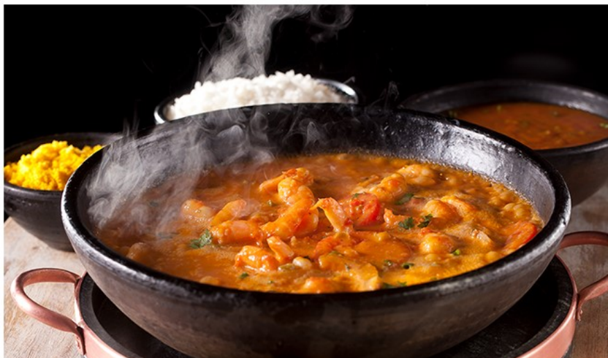
Moqueca de Camarão.

No quesito prato principal o Camarada traz a tradicional moqueca em várias versões. A Moqueca de Camarão (R$ 132), moqueca preparada em panela de barro vem acompanhada de arroz branco, farofa de dendê e pirão.