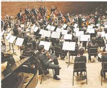
Orquestra é considerada a mais antiga do México