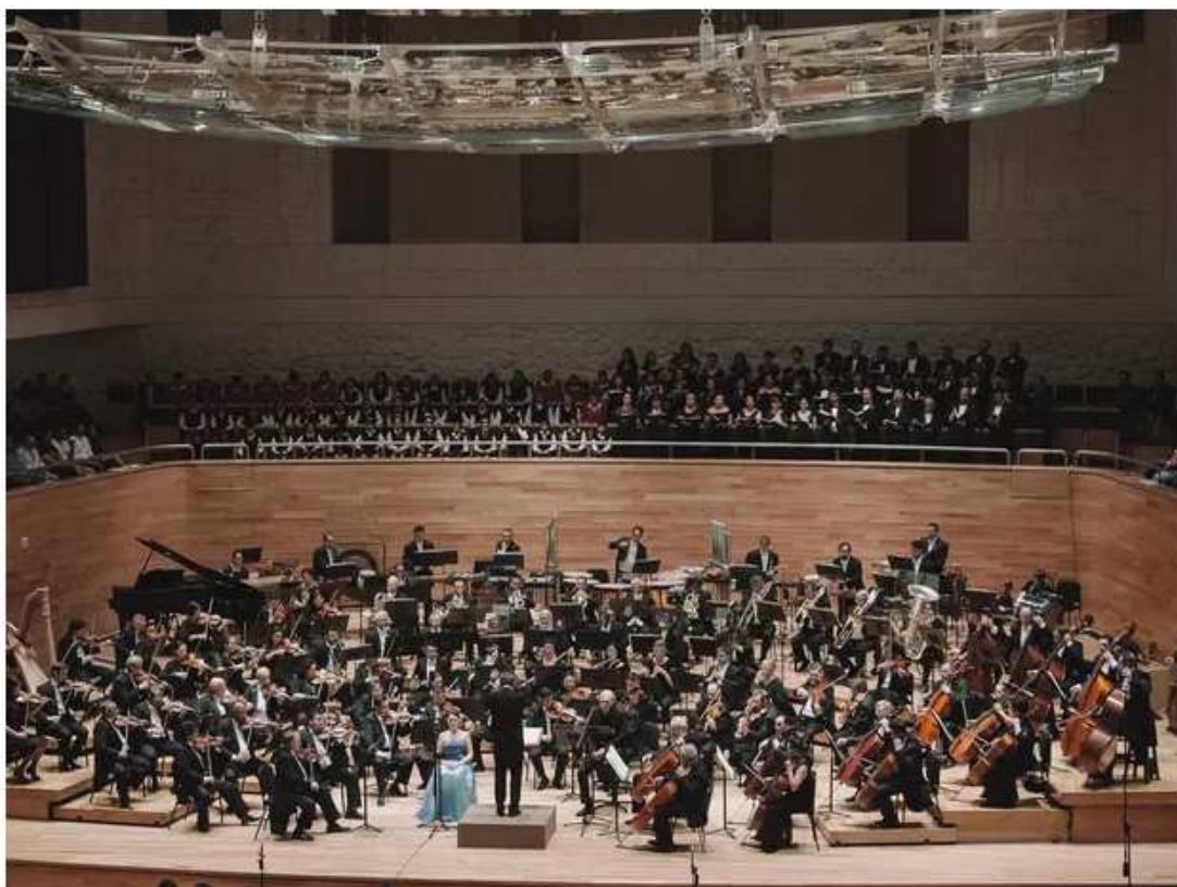
Orquestra Sinfônica de Xalapa é do México

Concerto gratuito acontece no Espaço Cultural. Apresentação vai ser às 20h30.