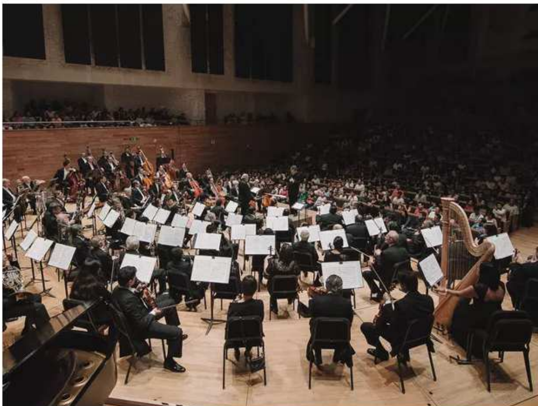
Sinfonia homenageia Marlos Nobre, Silvestre Revueltas, Claude Debussy e Richard Strauss

Apresentação acontece neste domingo (9), no Teatro Riachuelo, às 18h. Grupo funciona desde 1929 e é o mais antigo do país.