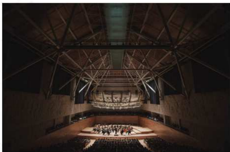
Sala de Concertos em Xalapa

Fundada em 1929, a OSX integra o complexo da Universidade de Veracruz e inaugurou há três anos sua sala de concertos, elogiada pela acústica.