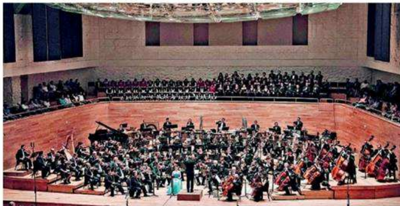
HISTÓRICA Fundada em 1949 em Vera Cruz, a Orquestra Sinfônica de Xalapa é a mais antiga do México e a formação de público entre os jovens é uma das preocupações da sua direção