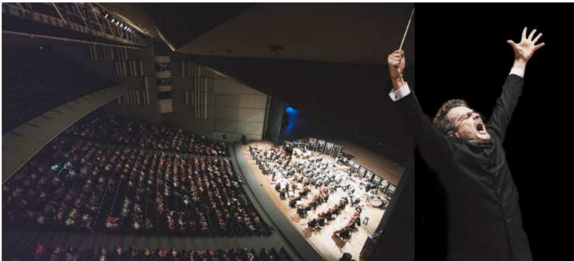
Orquestra de Xalapa e o regente Lanfranco Marcelletti