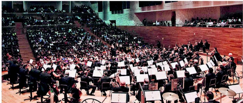
CLÁSSICO O repertório da Xalapa é diversificado, indo de Claude Debussy e Richard Strauss ao pernambucano Marlos Nobre e o mexicano Silvestre Revueltas

"Em meu primeiro concerto como diretor da OSX, em janeiro de