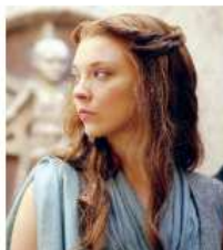
Atriz viveu a rainha Margaery em 'Game of Thrones'