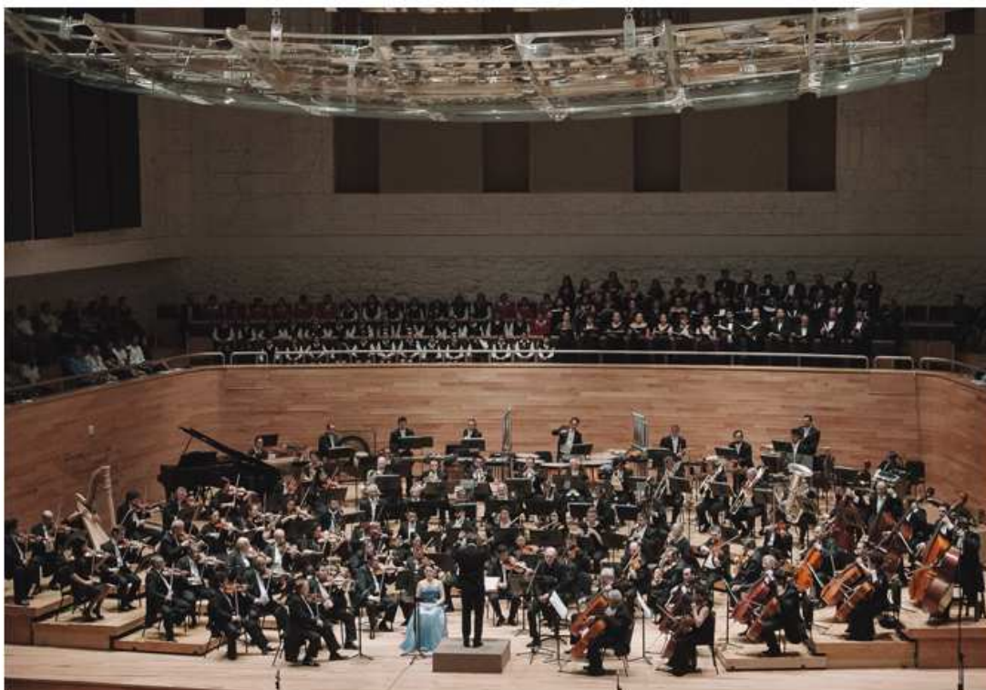
Orquestra Sinfônica de Xalapa