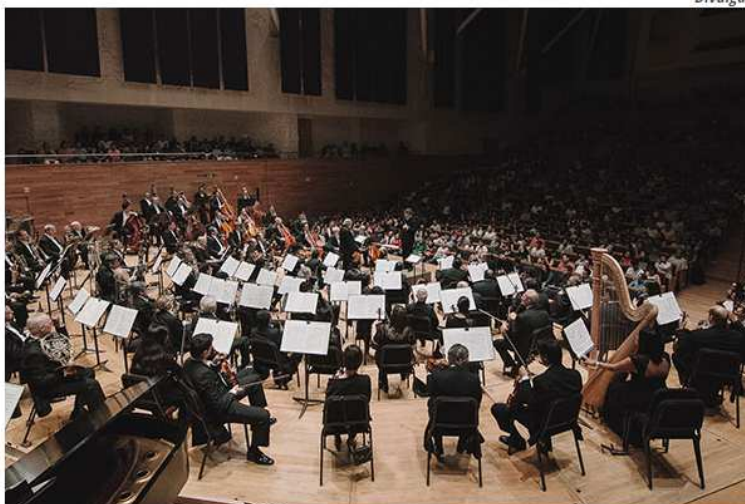
Orquestra Sinfônica de Xapala vai se apresentar com um repertório de músicas mexicanas, brasileiras e europeias